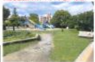
※芝生種立緑地内、トラック駐車 (要望)