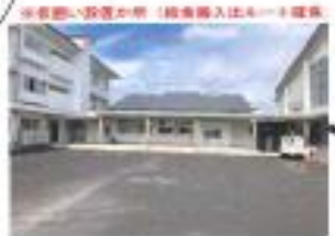
※敷地への設置場所 (結束扉入出ルート確保)