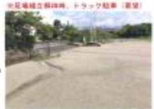
※芝生種立緑地内、トラック駐車 (要望)