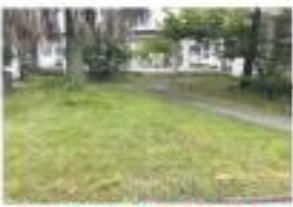
※芝生種別は人歩きのみ、工事車両通行可 ※児童クラブ生徒活動緑地