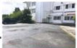
※大型クレーン設置 (区画及び設備員配置) ※敷地内側にクレーン配置時は、工事開始時駐車場 (要望)