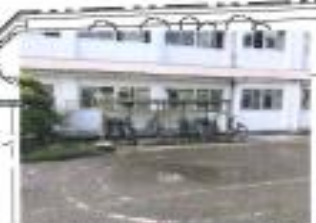
※両サイドのゲート確保し、西側より東西方向に駐車可能